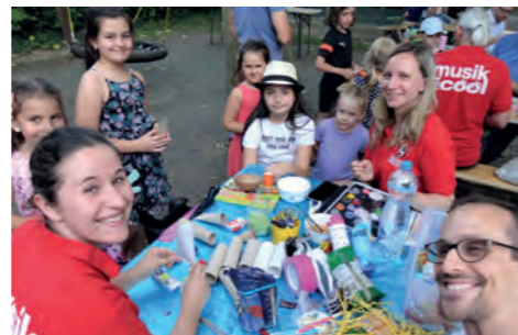
Instrumente basteln und Kinder schminken