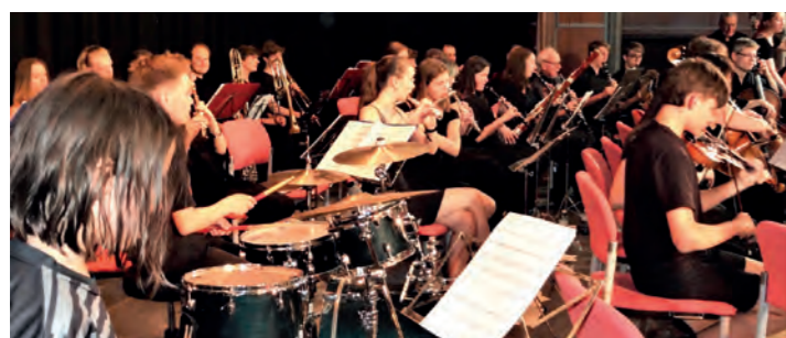
Klassik-Rock-Orchester beim Orchesterkonzert (Herwelly / Wolf)