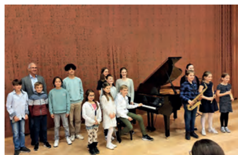
Klassenabend Klavier / Blockflöte / Saxophon (Kobald)