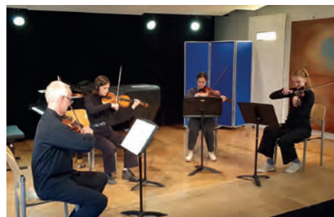
Klassenabend Geige und Bratsche (Amerer)

und man spürte förmlich den Hunger nach Livemusik. Wir sind froh und glücklich, dass wir unsere Kinder mit großem Engagement und Online-Unterricht erfolgreich durch die Pandemie begleiten konnten, denn das Niveau war durchwegs beachtlich, wobei ein großer Dank auch den Eltern gebührt. Hier ein paar Eindrücke: