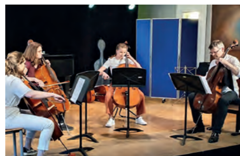
Klassenabend Cello (Waiz)