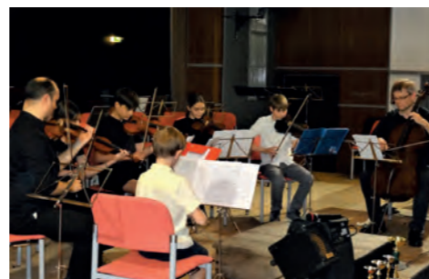
Orchester Zauberbögen beim Orchesterkonzert (Baumgartner)