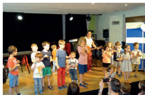
Musik, Früherziehung und Instrumentenkarussell (Herwelly)