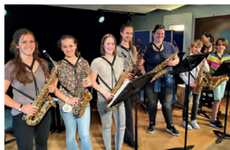
Klassenabend und Aktionstag Saxophon und Querflöte (Riegler)