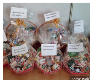
Wertvolle Geschenkkörbe bei der Tombola