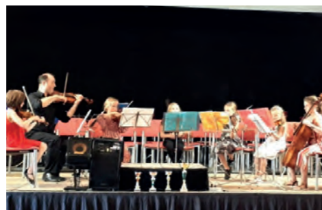
Sägwerk-Ensemble beim Orchesterkonzert (Baumgartner)