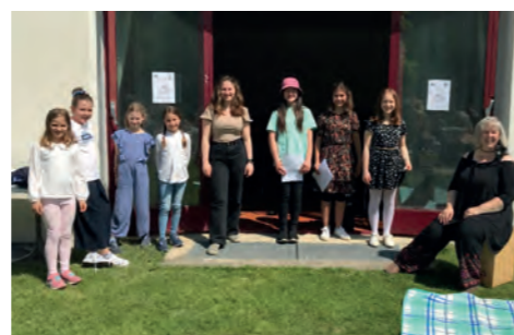
Musiknick open air (Glatz)