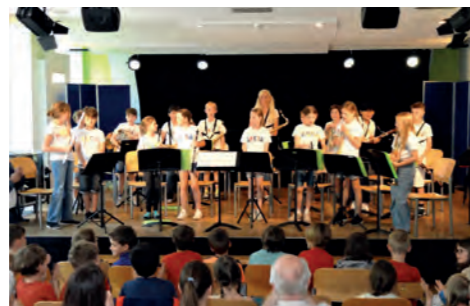
Konzert für die Kinder und Eltern der Bläserklasse (Zingler)