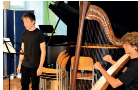
Duo Harfe – Gesang