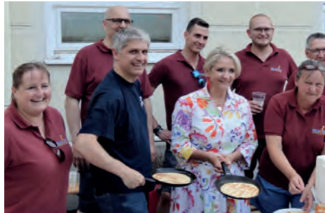
Palatschinkenstand der Blasmusik Mödling