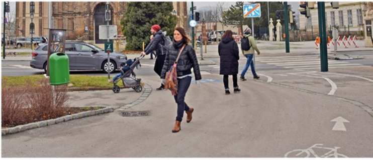
In der Stadt Mödling stehen unterschiedlichste Formen und Angebote der Mobilität zur Verfügung.