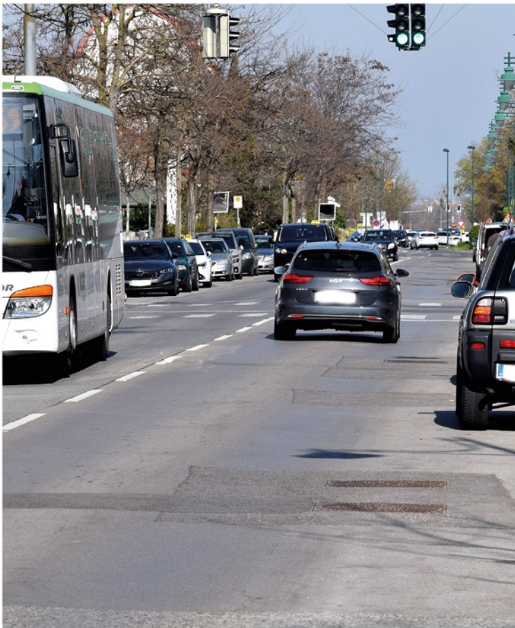
Ein Teilbereich der Wiener Straße wird im Zuge des Mödlinger Straßenbauprogrammes saniert.

Zusätzlich gibt es laufend Kleinflächensanierungen von Gehsteigen und Straßenteilstücken, die laut Prioritätsliste abgearbeitet werden.