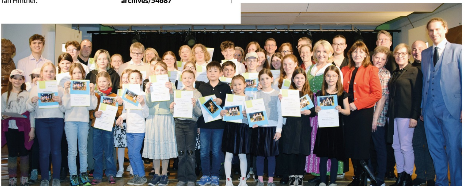
Die ausgezeichneten Schülerinnen und Schüler mit ihren Lehrkräften sowie den Ehrengästen vor dem Preisträgerkonzert im Festsaal der Beethoven-Musikschule.