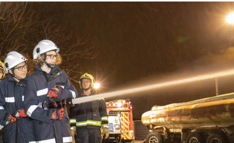
Früh übt sich: Nicht nur die Feuerwehrjugend, sondern auch die aktiven Feuerwehrleute absolvieren laufend Übungen, um für den Ernstfall gerüstet zu sein.

zu entfernen oder lose Dachteile zu sichern. Im Juli kam es zu einem schweren Unwetter in Mödling, wobei nahezu 26 Einsätze zeitgleich im gesamten Stadtgebiet abgearbeitet werden mussten. Bei einem Zimmerbrand im Oktober konnte durch den raschen Einsatz der Feuerwehr schlimmeres verhindert werden. Im November unterstützte die Feuerwehr Mödling die Freiwillige Feuerwehr Wiener Neudorf bei einem Wohnhausbrand.